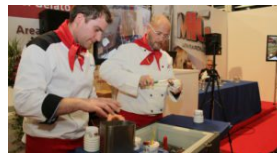
Mig, la top 10 dei gusti di gelato preferiti dai tedeschi