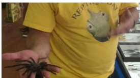
Tante novità a Reptiles Day: sarà l'edizione del Camaleonte