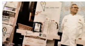
Gelato con Calici di Stelle, attesa per tappa Cortina