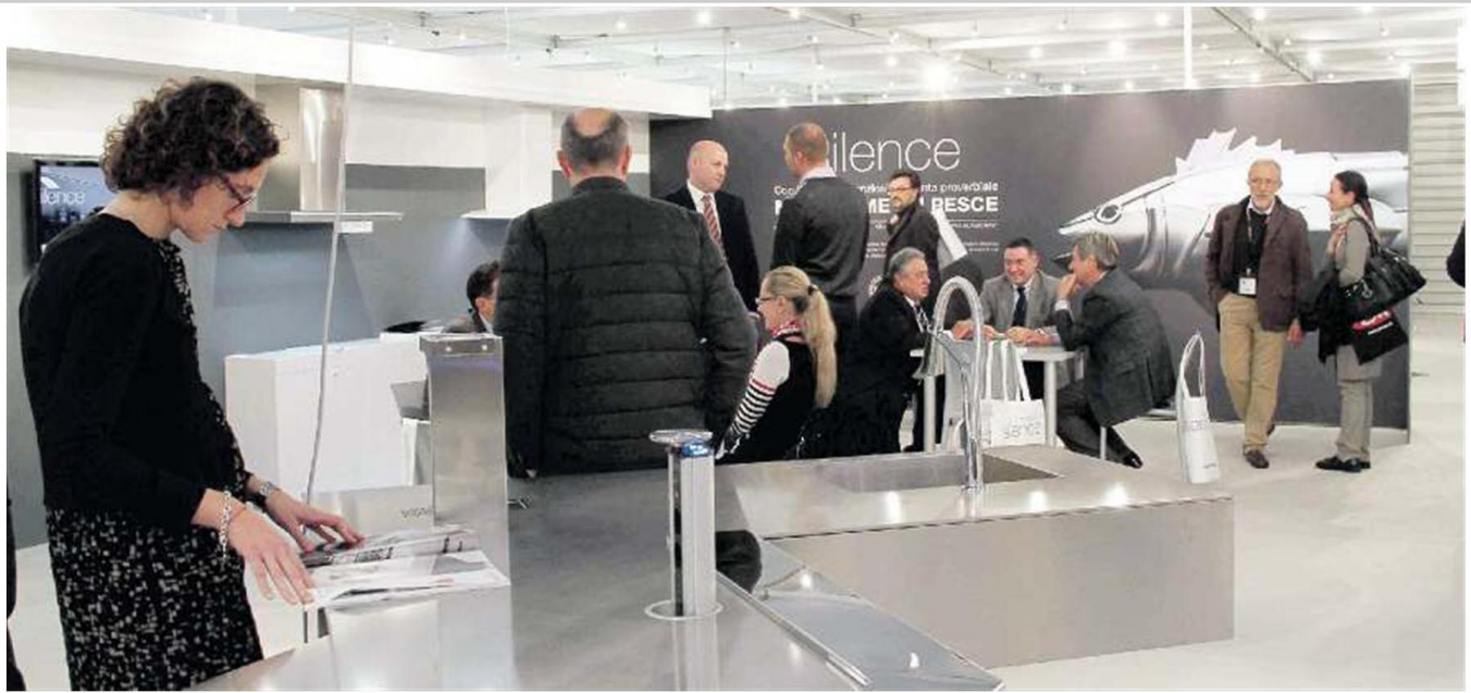
SICAM Presentata ieri la manifestazione che si terrà in Fiera: sarà l'occasione per mettere in vetrina una delle rassegne più importanti del territorio