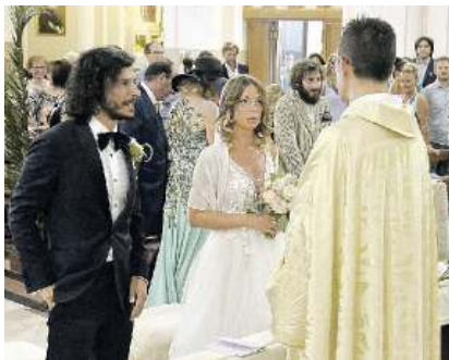
MATRIMONIO Elegante cerimonia tradizionale in chiesa con il prete

Tornano anche gli "Oscar del matrimonio", assegnati agli espositori per i matrimoni più belli, immortalati da scatti rappresentativi: votazioni sul web fino a questa sera. Nell'arena eventi inoltre si alterneranno esibizioni, presentazioni, sfilate, show cooking. Nutrita la presenza delle agenzie che offrono servizi e idee per animare la festa; dal prestigiatore al caricaturista ai palloncini. Sempre presente Confartigianato Por-