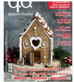
qb quanto basta dicembre 2019 copia digitale

Quello di Paolini non sarà l'unico: in arrivo anche il Premio BCC (banca partner della manifestazione), al miglior giovane chef del Triveneto. Un riconoscimento nato proprio per valorizzare gli astri nascenti del settore e, in generale, i protagonisti più giovani presenti nella scena della cucina italiana. Naturalmente ci saremo anche noi di qbquantobasta come media partner e presenteremo anche il nostro ultimo libro della collana Mittelcook.