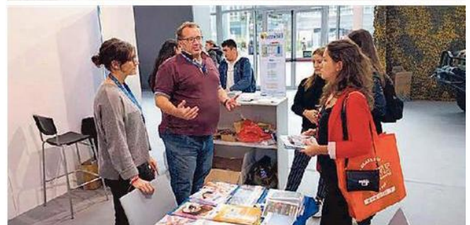
Alcuni momenti della 12esima edizione di "Punto d'incontro"

Hanno trovato molta curiosità anche vigili del fuoco, carabinieri, guardia di finanza e polizia.